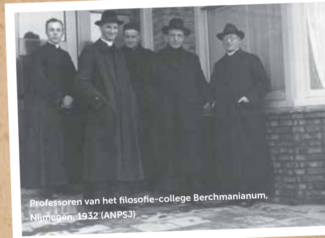
Professoren van het filosofie-college Berchmanium, Nijmegen, 1932